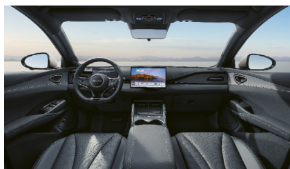
Čierna a modrá