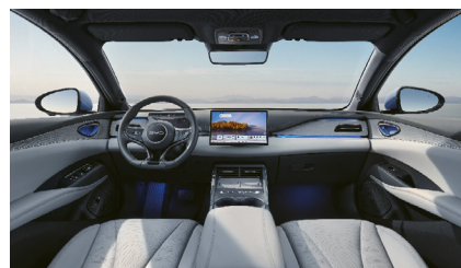
Čierna a sivá